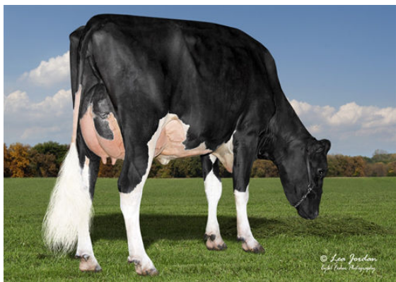
SCHREIBERDALE LITTLE WONKA