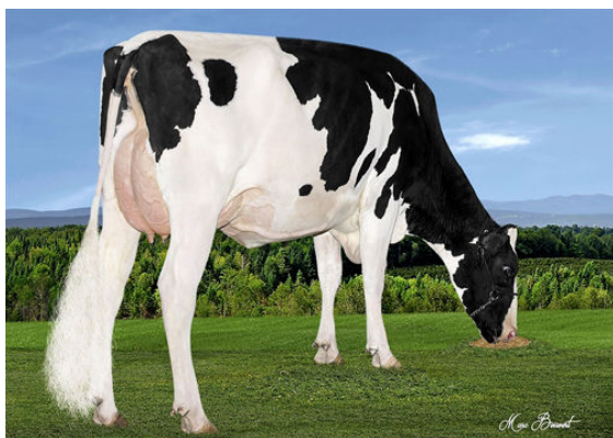
VAL-BISSON LITTLETON COLEUS