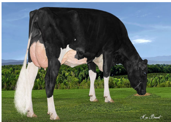
VAL-BISSON LITTLETON COLIBRI